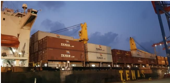
Gambar 4.3 MV. SELAT MAS Over Draft (SURABAYA-JAKARTA)