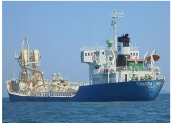
Gambar 1. KM Tonasa Lines XV

Penelitian dilakukan dari tanggal 24 Juli 2021 hingga 6 Juli 2022 di KM. Tonasa Lines XV milik PT. Tonasa Lines.