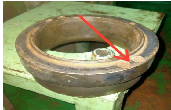
Gambar 5. Seat Valve mengalami penyumbatan

temperature katup buang dari suhu normal yang akan mengakibatkan kerusakan pada komponen katup buang. Kurang maksimalnya pendinginan pada bagian katup ini biasanya disebabkan oleh terjadinya penyumbatan pada jalannya air tawar di seating . Air pendingin berguna menyerap panas dari mesin agar temperatur kerja mesin tetap normal. Oleh karena itu agar penyerapan panas pada katup gas buang bekerja dengan baik maka komponen yang akan didinginkan harus bersih tidak ada penyumbatan karena adanya kotoran-kotoran seperti lumpur, kotoran dan kerak yang biasanya terdapat pada seat valve .