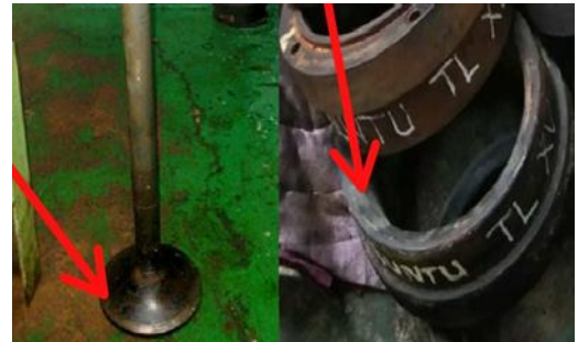
Gambar 3. Spindle dan Seat Valve mengalami keausan