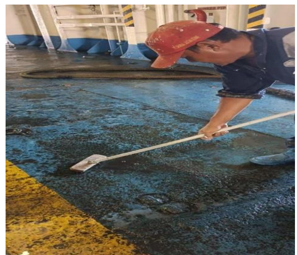
Gambar 3 Proses Menyikat Lantai Kapal