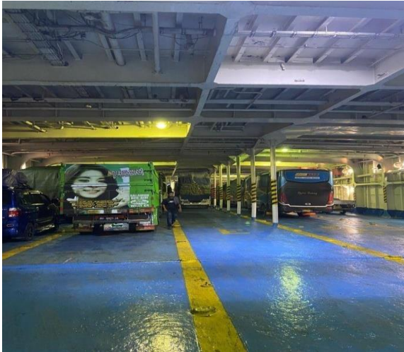
Gambar 4 Car Deck di KM. Kumala

Berdasarkan hasil pengolahan data maka penulis menemukan bahwa dalam persiapan car deck pada kapal KM. Kumala sudah sesuai dengan prosedur yang berlaku namun ditemukan beberapa kendala yaitu kurangnya waktu dalam pengeringan lantai kapal pada saat melakukan cleaning kapal yang dapat menyebabkan bahaya tergelincir bagi awak kapal maupun penumpang. Oleh karena itu, beberapa hal demikian bisa menjadi bagian pemecah masalah, yaitu :